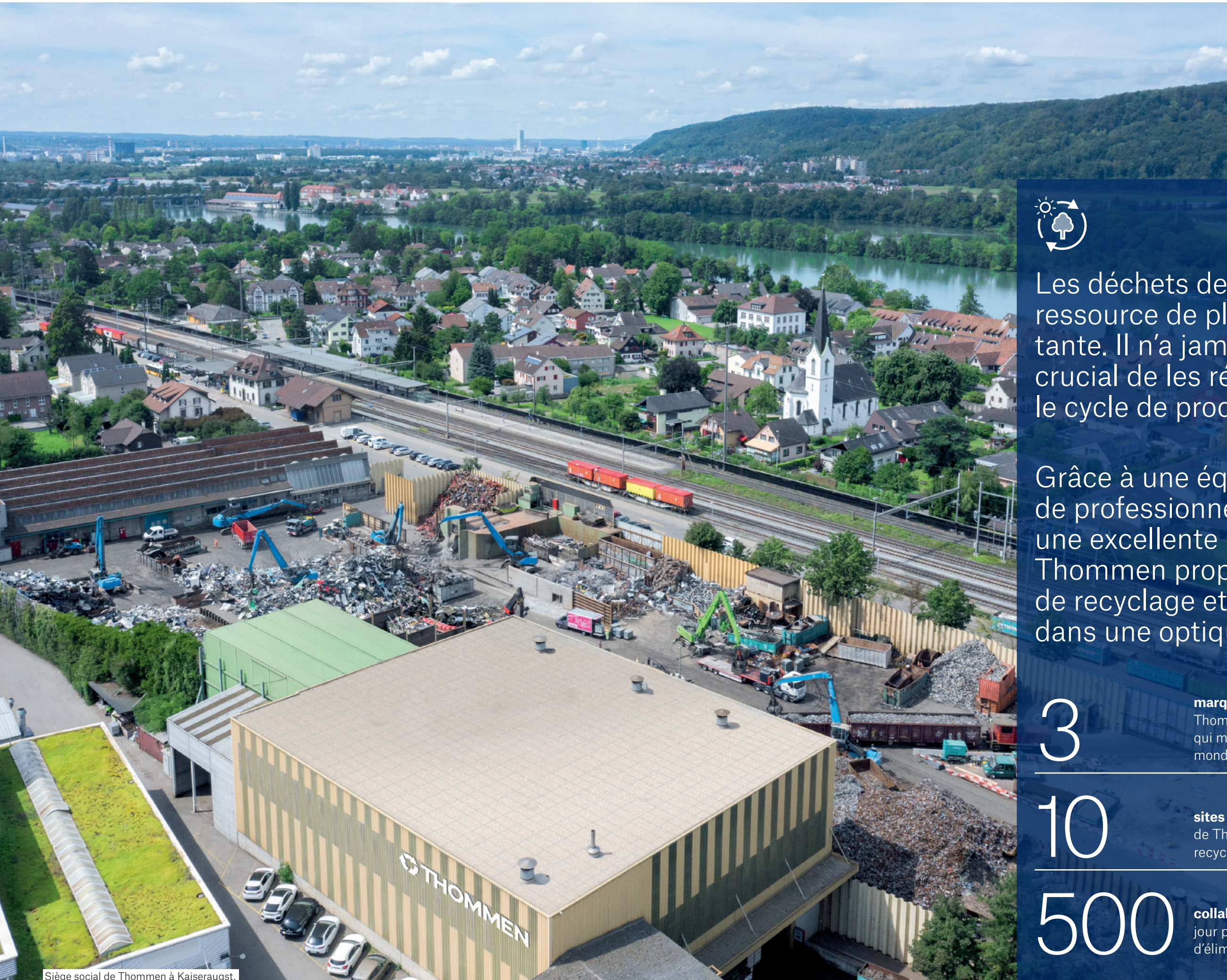
Siège social de Thommen à Kaiseraugst.